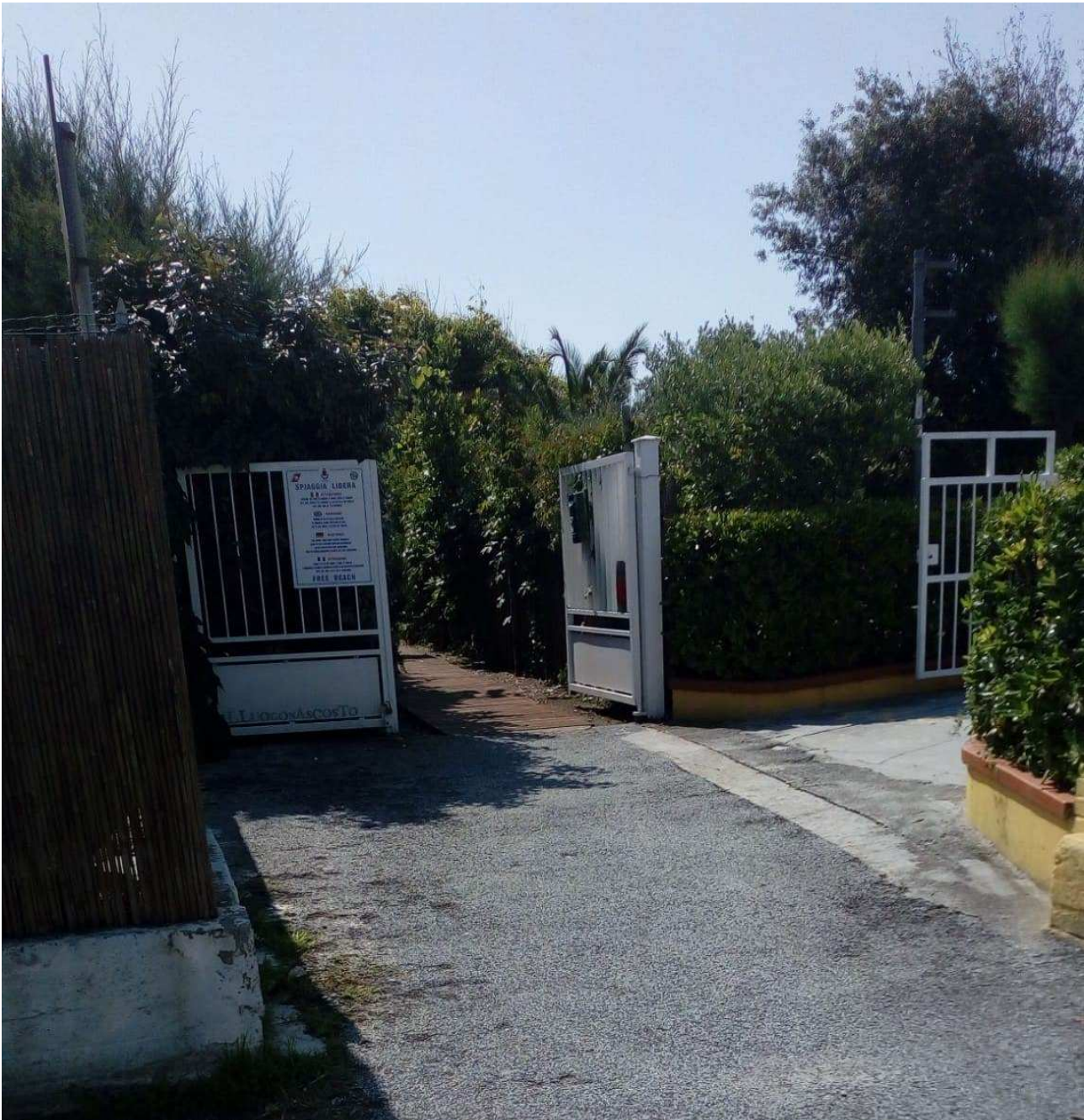
Foto accesso spiaggia dal chiosco comunale